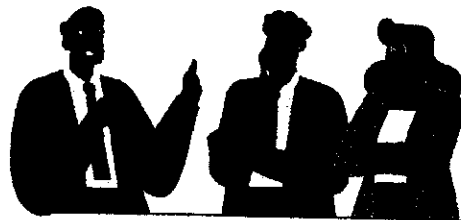
หลักสูตร Smart City (หลักสูตรต่อเนื่อง) กลุ่มเอกชน