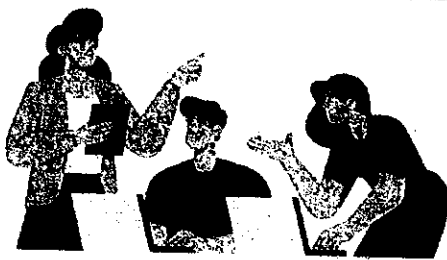
หลักสูตร Smart City กลุ่มประชาชนทั่วไป

เรียนฟรี! เรียนออนไลน์ได้ทุกวัน ไม่เสียค่าเล่าเรียน