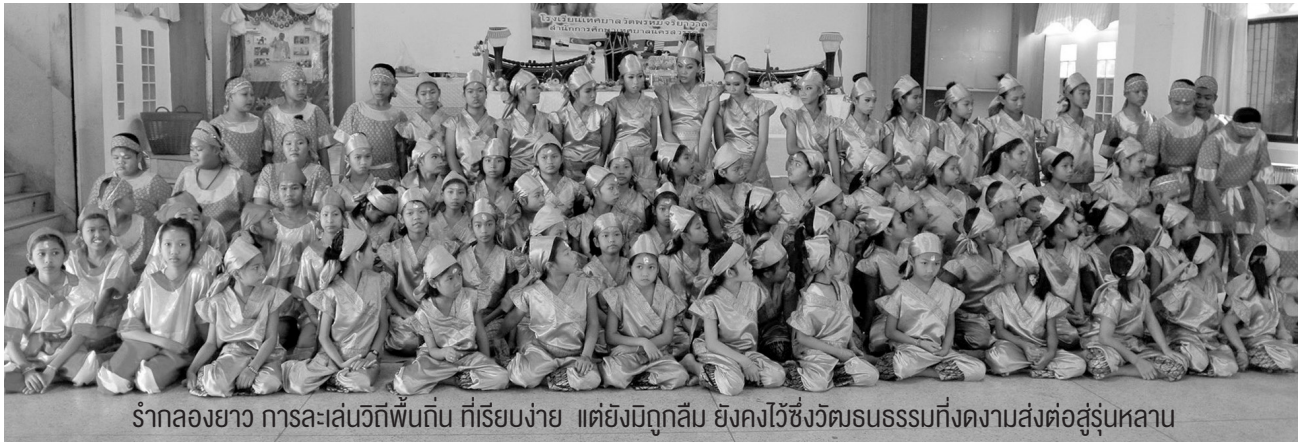
รำกลองยาว การละเล่นวิถีพื้นถิ่น ที่เรียบง่าย แต่ยังมีกฎลึกลับ ยังคงไว้ซึ่งวัฒนธรรมที่งดงามส่งต่อสู่รุ่นหลาน

“รำกลองยาว” เป็นการละเล่นพื้นถิ่นของชาวจังหวัดนครสวรรค์ที่มีมายาวนาน ท่าร้ายรำและเนื้อเพลงจะมีจังหวะที่สนุกสนานตลอดจนมีการแสดงต่อตัวโชว์โดยใช้กลองยาว เพื่อให้เกิดความตื่นเต้นและครึกครื้นต่อผู้เล่นและผู้ชม ตลอดจนเสื้อผ้าหน้าผมที่แต่เดิมไม่มีแบบแผน แต่ต่อมาได้คิดประดิษฐ์ชุดขึ้นมาใหม่โดยแปลงจากชุดลิเก โดยจะนิยมเล่นตามงานต่างๆ อย่างงานตรุษ งานสงกรานต์ งานแห่หน้าค แห่พระและแห่กฐิน ฯลฯ และทุกครั้งก่อนการรำกลองยาวจะมีพิธีไหว้ครู เช่นเดียวกับคณะกลองยาวโรงเรียนเทศบาลวัดพรหมจริยวาส จะมีพิธีไหว้ครูกลองยาวก่อนการเล่นทุกครั้ง รวมถึงพิธีไหว้ครูกลองยาวและครอบครัวคนไทยซึ่งทำการจัดขึ้นเป็นประจำทุกปี